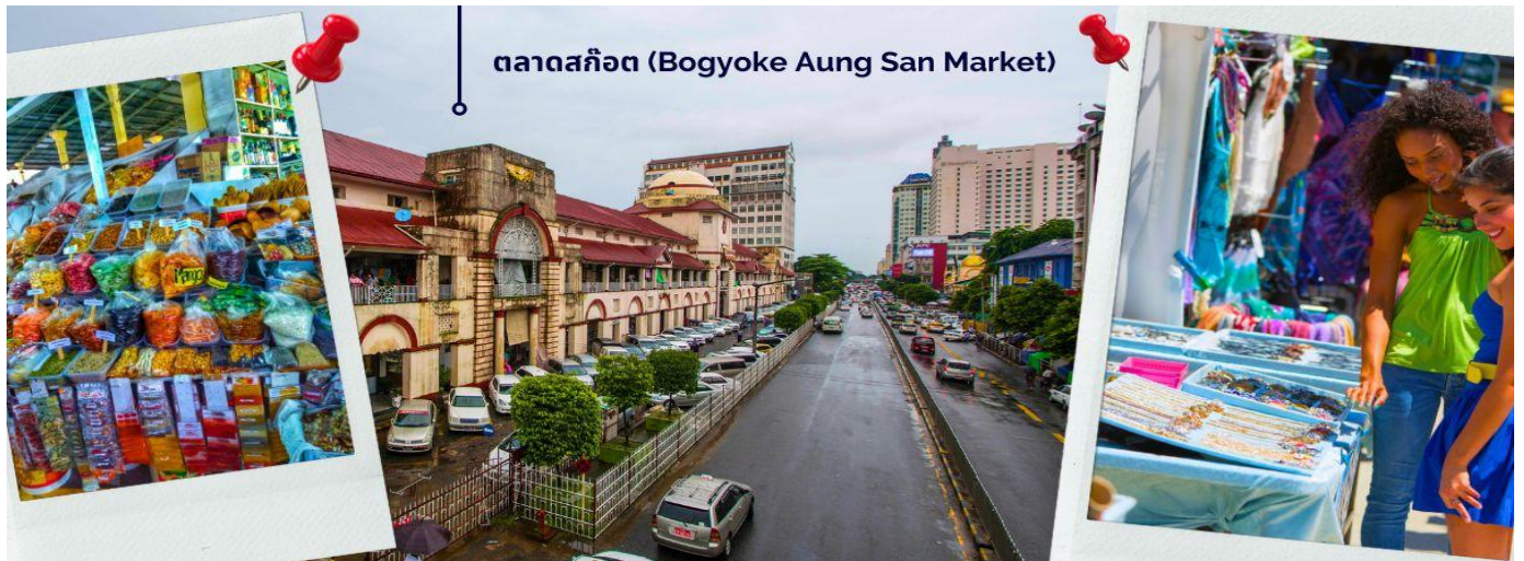
ตลาดสก๊อต (Bogyoke Aung San Market)

ให้ท่านได้มีเวลากับการเลือกซื้อของฝาก ของที่ระลึกต่างๆ ทั้งสินค้าพื้นเมืองที่มีชื่อเสียงของพม่าที่ ตลาดสก๊อต (Bogyoke Aung San Market) นี่คือนตลาดที่ใหญ่ที่สุดในย่างกุ้ง เป็นแหล่งช้อปปิ้งที่มีสินค้าวางขายแทบทุกชนิด เปรียบเสมือนตลาดนัดจตุจักรของบ้านเราก็ดำเนินได้ นอกจากสินค้าพื้นเมืองแล้ว ตลาดแห่งนี้ยังเป็นแหล่งรวมสินค้าประเภทอัญมณีที่เป็นที่รู้จักไปทั่วโลกนั่นคือ หยกพม่า (หากซื้อสินค้าหรืออัญมณีที่มีราคาสูง ควรขอใบเสร็จรับเงินทุกครั้ง เนื่องจากจะต้องแสดงให้เจ้าหน้าที่ศุลกากรหากมีการขอตรวจสอบ)