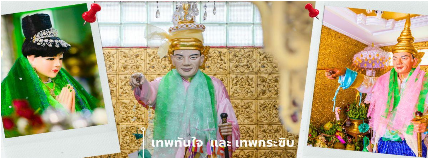
เทพทันใจ และ เทพกระซิบ

C8MR1 ย่างกุ้ง-หงสาว-พระธาตุนรินทร์แขวน-เจดีย์กลางน้ำลิเรียม 3 วัน 2 คืน บิน 8M (SEP-MAR25)