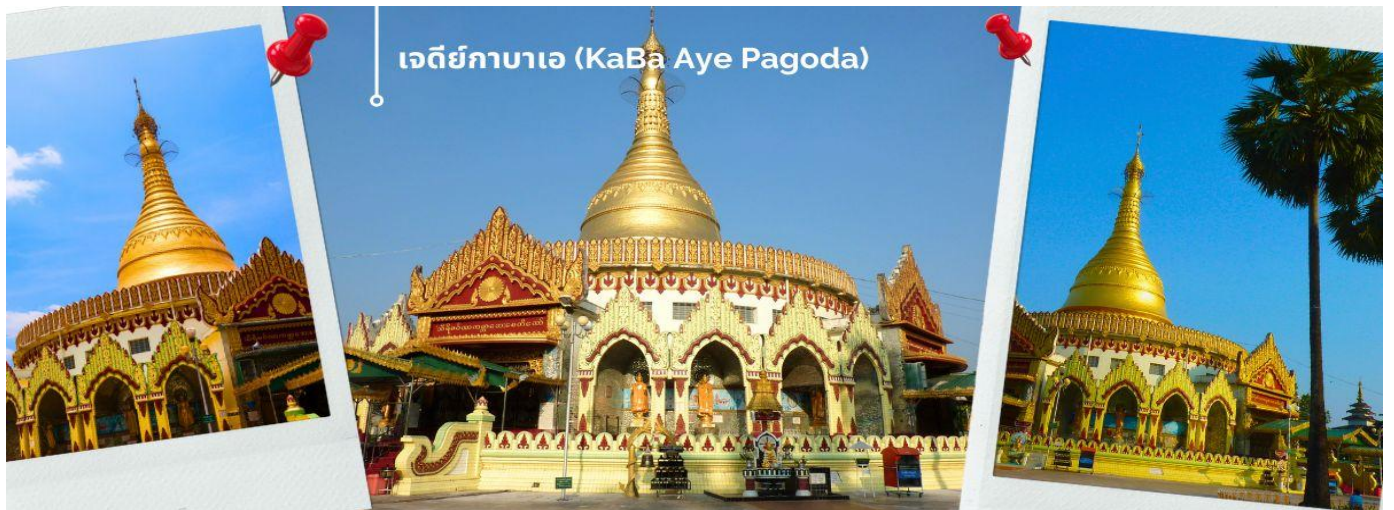
เจดีย์กาบาเอ (KaBa Aye Pagoda)

จากนั้นนำท่าน เดินทางไปยัง เจดีย์กาบาเอ (KaBa Aye Pagoda) เพื่อร่วมพิธี เทินพระธาตุ พิธีอันศักดิ์สิทธิ์ เป็นเจดีย์ทรงกลมครึ่ง ซึ่งมีความสูงทั้งหมดห้าด้านด้วยกัน นายอุหนายคนแรกของพม่า ได้สร้างขึ้นเพื่อใช้เป็นสถานที่ชำระพระไตรปิฎก สูง 34 เมตร สร้างขึ้นเมื่อปี 1952 เพื่อทำการสังคายนา พระไตรปิฎกครั้งที่ 6 เป็นเจดีย์ที่มีความสวยงามและแปลกตา ภายในบรรจุพระอัฐิธาตุของพระอัครสาวกแห่งองค์พระสัมมาสัมพุทธเจ้า คือพระโมคคัลลานะและพระสารีบุตร จะมีทางเข้าทั้งหมดห้าด้าน ทุกด้านมีพระพุทธรูปประดิษฐานอยู่บนฐานทักษิณ มีพระพุทธรูปหุ้มด้วยทองคำองค์เล็ก ๆ อีก 28 องค์ แทนอดีตสาวกของพระพุทธเจ้าทั้ง 28 องค์ ที่อุบัติขึ้นในโลกนี้ ส่วนพระพุทธรูปองค์พระประธานที่อยู่ข้างในหล่อด้วยเงินบริสุทธิ์มีน้ำหนัก กว่า 500 กิโลกรัม และ เข้าร่วมพิธีเทินพระธาตุเพื่อความเป็นสิริมงคล