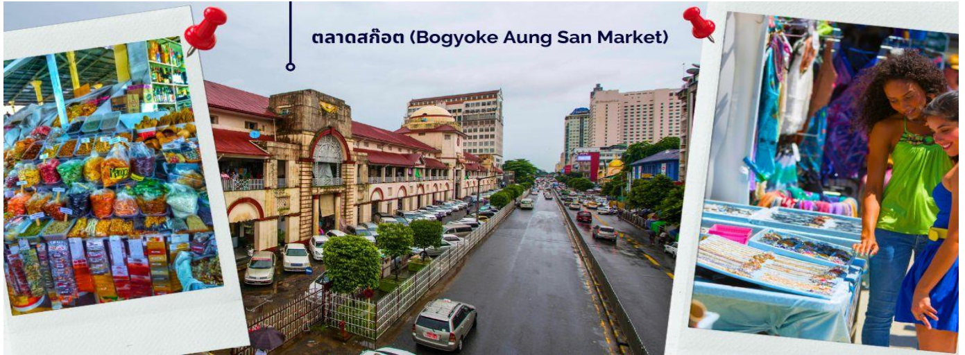
ตลาดสก๊อต (Bogyoke Aung San Market)

ให้ท่านได้มีเวลาเลือกซื้อของฝาก ของที่ระลึกต่างๆ ทั้งสินค้าพื้นเมืองที่มีชื่อเสียงของพม่าที่ ตลาดสก๊อต (Bogyoke Aung San Market) นี่คือนครที่ใหญ่ที่สุดในย่างกุ้ง เป็นแหล่งช้อปปิ้งที่มีสินค้าวางขายแทบทุกชนิด เปรียบเสมือนตลาดนัดจตุจักรของบ้านเราก็ดูว่าได้ นอกจากสินค้าพื้นเมืองแล้ว ตลาดแห่งนี้ยังเป็นแหล่งรวมสินค้าประเภทอัญมณีที่เป็นที่รู้จักไปทั่วโลกนั่นคือ หยกพม่า (หากซื้อสินค้าหรืออัญมณีที่มีราคาสูง ควรขอใบเสร็จรับเงินทุกครั้ง เนื่องจากจะต้องแสดงให้เห็นหน้าที่ศุลกากรหากมีการขอตรวจสอบ)