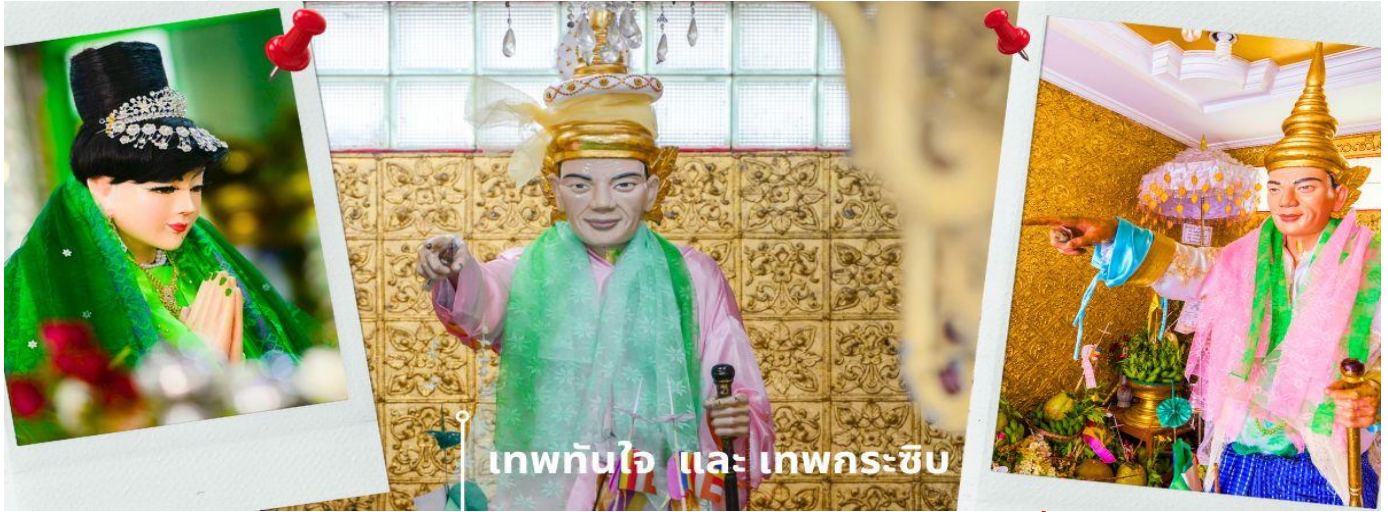
เทพทันใจ และ เทพกระซิบ

C8MR1 ย่างกุ้ง-หงสาว-พระธาตุนิทรแชน-เจดีย์กลางน้ำลิเรียม 3 วัน 2 คืน บิน 8M (SEP-MAR25)