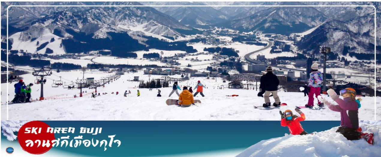
SKI AREA GYOJI ลานสกีเมืองกุโจ

วันที่สาม เมืองกุโจซาจิมัง – ลานสกีเมืองกุโจ – เมืองกิฟุ – หมู่บ้านมรดกโลกชิราคาวาโกะ – เมืองทาคายามะ – ถนนชินมาจิซุจิ – เมืองนาโกย่า