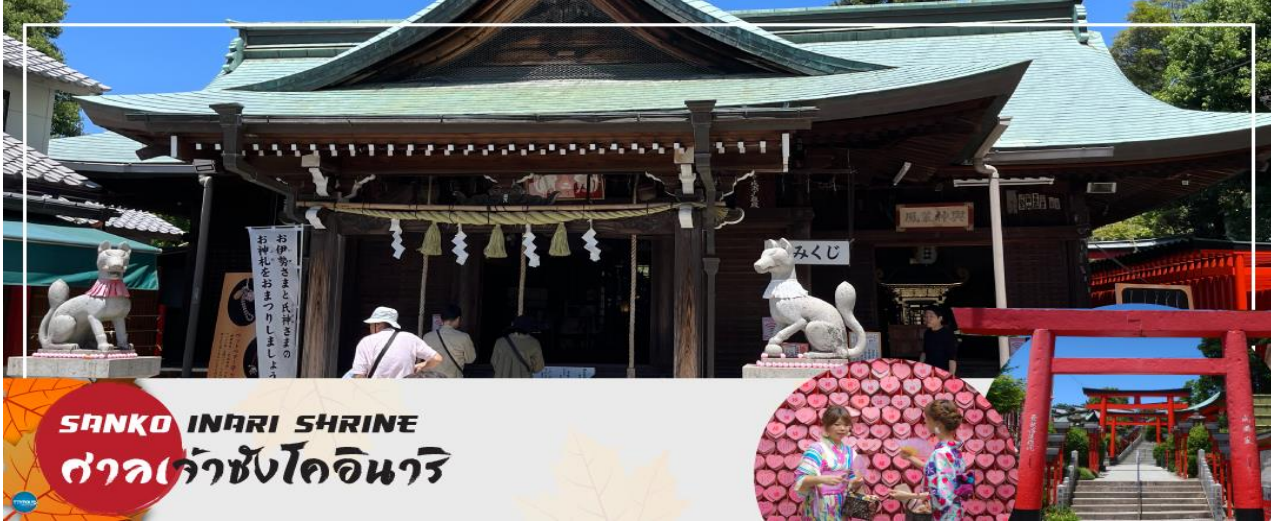
SANKO INARI SHRINE ศาลเจ้าซังโคอินาริ

จากนั้นนำท่านเดินทางสู่ ศาลเจ้าซังโคอินาริ (Sanko Inari Shrine) ตั้งอยู่ใกล้ๆ กับปราสาทอินุยามะ ศาลเจ้านี้มีชื่อเสียงเรื่องความรัก คู่รักมักจะมาขอพรให้มีความสัมพันธ์ที่ดี ชีวิตคู่ราบรื่น ครอบครัวยาวนาน ส่วนคนโสดก็จะขอให้ได้พบเจอคู่แท้จุดเด่นคือเสาโทริอิสีแดงที่เรียงรายสวยงาม และแผ่นป้ายขอพรรูปหัวใจสีชมพู ที่นี่ยังช่วยเรื่องการเงินอีกด้วย ว่ากันว่าถ้านำเงินมาล้างที่ป้อนน้ำศักดิ์สิทธิ์ภายในศาลเจ้า จะช่วยให้เงินนั้นงอกเงยขึ้นหลายเท่า ครอบครัวยุเจริญรุ่งเรือง