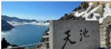
อุทยานจางไปซาน