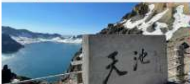
อุทยานจางไปซาน