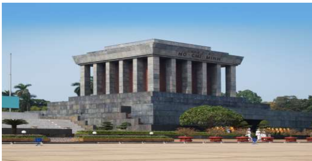
6 ภาพใช้เพื่อการโฆษณาเท่านั้น

นำท่านเดินทางสู่ จัตุรัสบาติงห์ ลานกว้างที่ประธานาธิบดีโฮจิมินห์ได้อ่านคำประกาศอิสรภาพของเวียดนามพ้นจากฝรั่งเศสเมื่อ 2 ก.ย. 2488 หลังจากเวียดนามตกเป็นเมืองขึ้นของฝรั่งเศสอยู่ถึง 84 ปี นำท่านชม สุสานประธานาธิบดี โฮจิมินห์ (บริเวณด้านนอก) วีรบุรุษตลอดกาลของชาวเวียดนาม ผู้ที่รวมเวียดนามเป็นประเทศ และยังเป็นผู้ประกาศเอกราชให้กับประเทศเวียดนามภายในสุสานบรรจุศพท่านประธานาธิบดี ซึ่งได้ทำการเก็บรักษาศพไว้เป็นอย่างดีไมให้เน่าเปื่อย โดยมีเจ้าหน้าที่ดูแลไว้อย่างเข้มงวด