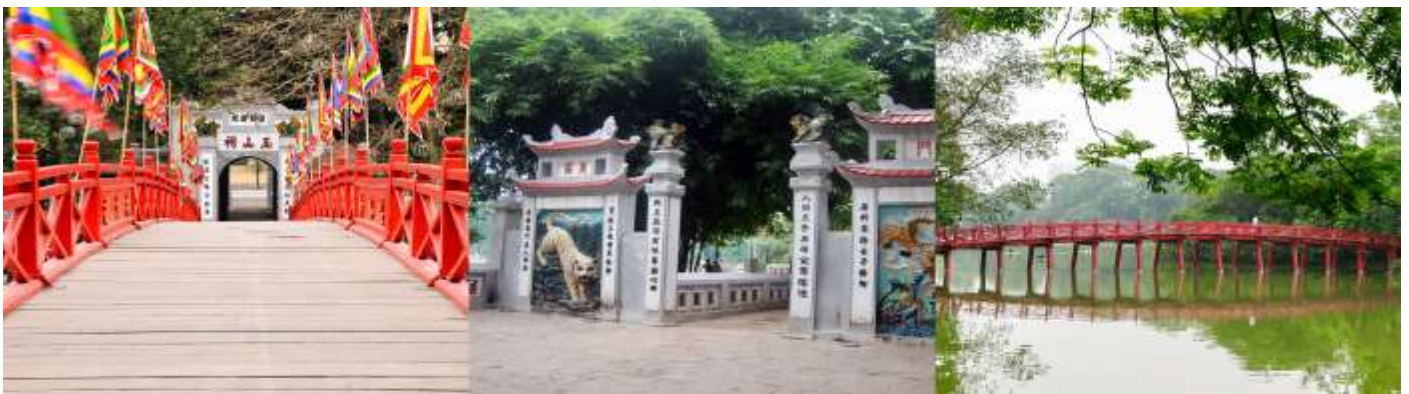
7 ภาพใช้เพื่อการโฆษณาเท่านั้น

จากนั้นเดินทางสู่ ทะเลสาบคินดาบ ทะเลสาบใจกลางเมืองฮานอย ทะเลสาบแห่งนี้มีตำนานกล่าวว่า ในสมัยที่เวียดนามทำสงคราม สู้รบกับประเทศจีน กษัตริย์แห่งเวียดนามได้สงครามมาเป็นเวลานาน แต่ยังไม่สามารถเอาชนะทหารจากจีนได้สักที ทำให้เกิดความท้อแท้พระทัย เมื่อได้มาล่องเรือที่ทะเลสาบแห่งนี้ได้มีปฏิหารย์ เต่าขนาดใหญ่ตัวหนึ่งได้รับดาบวิเศษมาให้พระองค์ เพื่อทำสงครามกับประเทศจีน หลังจากที่พระองค์ได้รับดาบมานั้น พระองค์ได้กลับไปทำสงคราม อีกครั้ง และได้รับชัยชนะเหนือประเทศจีน ทำให้บ้านสงบสุข เมื่อเสร็จศึกสงครามแล้วพระองค์ได้นำดาบมาคืน ณ ทะเลสาบแห่งนี้ และถ่ายรูปกับสะพานเทพสุดหรือสะพานแสงอาทิตย์ที่เชื่อมระหว่างริมฝั่งกับเกาะกลางทะเลสาบ