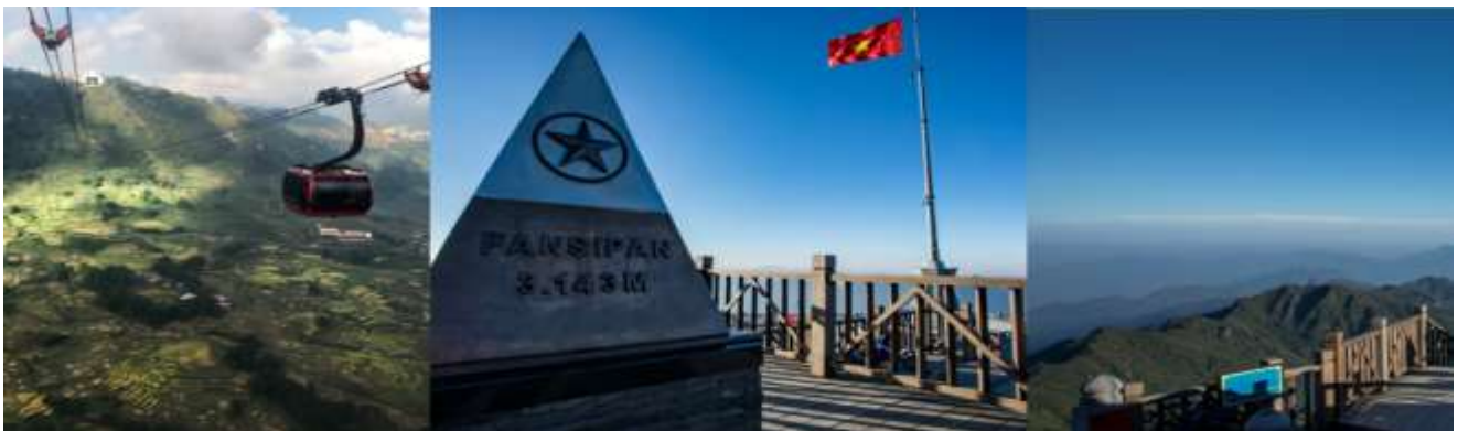
4 ภาพใช้เพื่อการโฆษณาเท่านั้น

นำท่าน นั่งกระเช้าไฟฟ้า สู่ ยอดเขาฟานซีปัน เป็นยอดเขาที่สูงที่สุดในเวียดนามและในอินโดจีน ด้วยความสูงจากระดับน้ำทะเล 3,143 เมตร จึงได้รับการกล่าวขานว่า “หลังคาแห่งอินโดจีน” ซึ่ง กระเช้าไฟฟ้าสามารถนั่งได้ถึง 30 คน ใช้เวลาเดินทางประมาณ 20 นาที (รวมค่ากระเช้าใหญ่+ค่า รถราง) หมายเหตุ : หากวันที่เดินทางไปฟานซีปัน แล้วกระเช้ามีการปิดปรับปรุงเนื่องจากสภาพ อากาศหรือเหตุการณ์ใดๆ ที่ไม่สามารถขึ้นกระเช้าได้ ทางบริษัทจะทำการปรับเปลี่ยนโปรแกรมตาม ความเหมาะสม และคืนเงินค่าส่วนต่างคืน