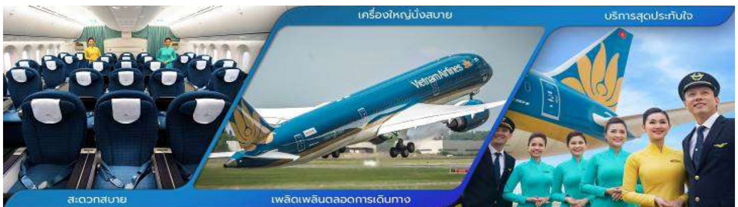
3 ภาพใช้เพื่อการโฆษณาเท่านั้น

เนื่องจากเป็นตั๋วกรุ๊ประบบจะทำการ Random ไม่สามารถเลือกที่นั่งได้ ที่นั่งอาจจะไม่ติดกัน ต้อง Requestขอที่นั่งหน้าเคาเตอร์เท่านั้น