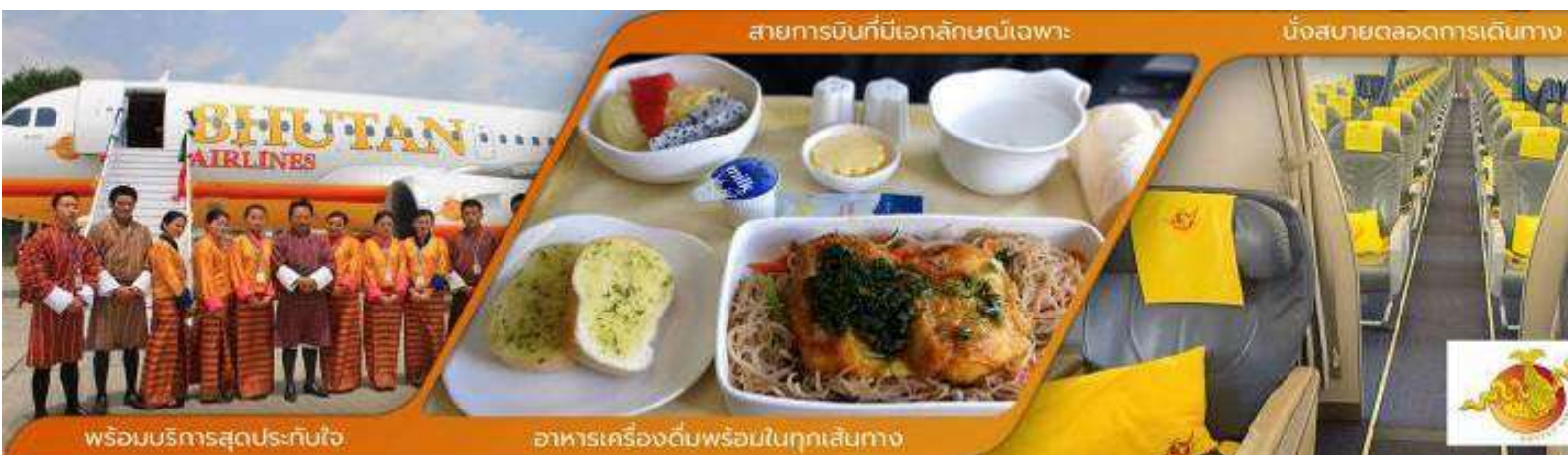
สายการบินที่มีเอกลักษณ์เฉพาะ

06.30 น. ออกเดินทางสู่ เมืองพาร์ ประเทศภูฏาน โดย สายการบิน BHUTAN AIRLINE เที่ยวบินที่ B3-701 (มีบริการอาหารและเครื่องดื่มบนเครื่อง) (เครื่องบินแวะรับส่งผู้โดยสารที่เมืองกัลกัตตา ประเทศอินเดียประมาณ 45 นาที ***ไม่ต้องลงจากเครื่อง*** )