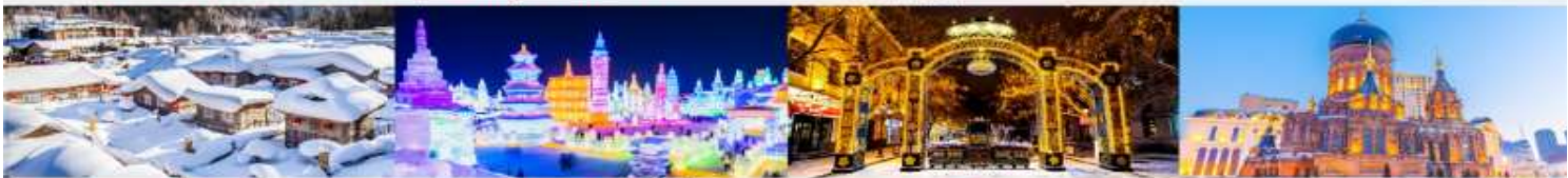
หมู่บ้านหิมะ เทศกาลโคมไฟน้ำแข็ง ถนนคนเดินจงหยาง โบสถ์เซนต์โซเฟีย

*ทางบริษัทฯ ขอสงวนสิทธิ์ในการปรับเปลี่ยนโปรแกรมทัวร์ตามความเหมาะสมขึ้นอยู่กับสถานการณ์หน้างาน โดยคำนึงถึงผลประโยชน์ของลูกค้าเป็นสำคัญ