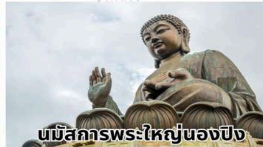
นมัสการพระใหญ่ของปิง