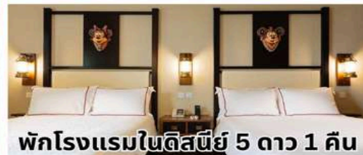
พักโรงแรมในดิสนีย์ 5 ดาว 1 คืน