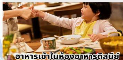
อาหารเช้าในห้องอาหารดิสนีย์