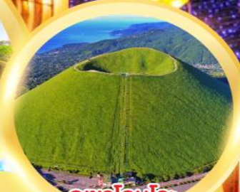
ภูเขาไฟฟูจิ