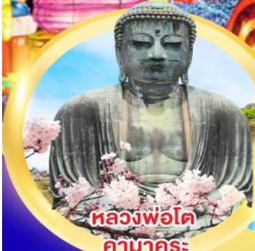
หลวงพ่อดโต คามาคูระ

ชมงานประดับไฟ 1 ใน 3 ของญี่ปุ่น อิซุโคเก็น แกรนด์อิลลูมิ