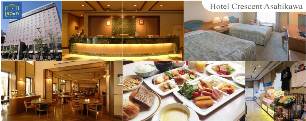
Hotel Crescent Asahikawa

รับประทานอาหารเย็น ณ ภัตตาคาร (2) HOTEL CRESCENT ASAHIKAWA หรือเทียบเท่าระดับเดียวกัน