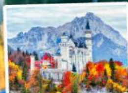
ปราสาทน้อยชวานส์ไตน์

08-14, 16-22, 21-27 ต.ค. 69 04-10 พ.ย. 69 29 พ.ย.-05 ธ.ค. 69 30 ธ.ค. 69-05 ม.ค. 70