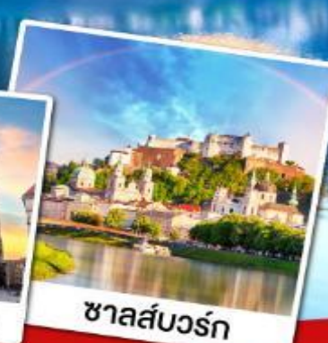
ชาลส์บวร์ก