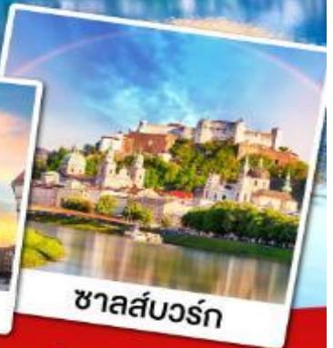
ชาลส์บวร์ก

เที่ยวหมู่บ้านฮิลสติกที่สวยงามที่สุดในโลก เข้าชมความงดงามภายในของปราสาทนอยชวานสไตน์