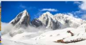
ภูเขาหิมะมิงกรหยก