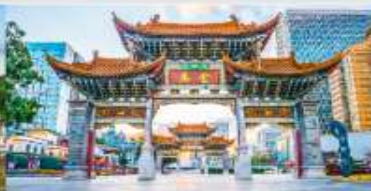
ประตูม้าทอง ไร่หยก