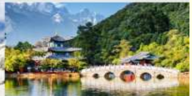
สระมิงกรต้า

*ทางบริษัทฯ ขอสงวนสิทธิ์ในการสลับโปรแกรมทัวร์ตามความเหมาะสมขึ้นอยู่กับสถานการณ์ปฏิบัติงาน โดยค่าใช้จ่ายดังผลประโยชน์ของลูกค้าเป็นสำคัญ