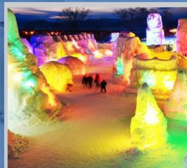
"SHIKOTSU ICE FEST"