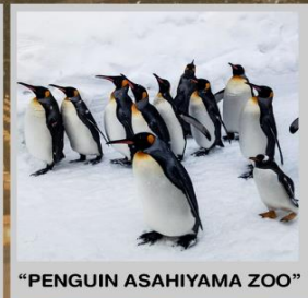
"PENGUIN ASAHIYAMA ZOO"