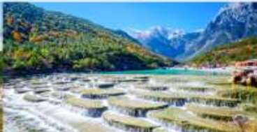
ทะเลสาบไป๋สุ่ยเหอ