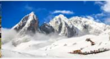
ภูเขาคิมะมังกรหยก