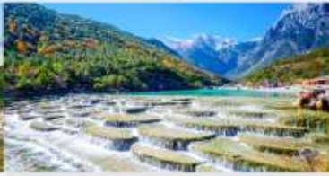
ทะเลสาบไป๋ส่วยเหอ