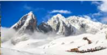
ภูเขาคิมะมังกรหยก