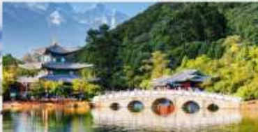
สระมิงกรต้า

*ทางบริษัทฯ ขอสงวนสิทธิ์ในการสืบโปรแกรมทัวร์ตามความเหมาะสมขึ้นอยู่กับสถานการณ์ปัจจุบัน โดยคำนึงถึงผลประโยชน์ของลูกค้าเป็นสำคัญ