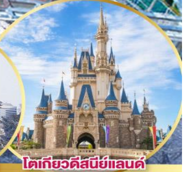
โตเกียวดิสนีย์แลนด์

พักโตเกียว 2 คืน พักออนเซ็น 1 คืน พร้อมเมนูญี่ปุ่น