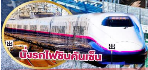
นั่งรถไฟชินคันเซ็น