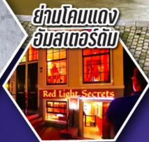
ย่านโคมแดง อัมสเตอร์ดัม

ตะลุยอัมสเตอร์ดัม ทั้งจัตุรัสดามสแควร์ และย่านโคมแดง (Red Light)