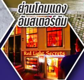
ย่านโคมแดง อัมสเตอร์ดัม

ตะลุยอัมสเตอร์ดัม ทั้งจัตุรัสดามสแควร์ และย่านโคมแดง (Red Light)