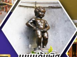
แมมเกินพีล