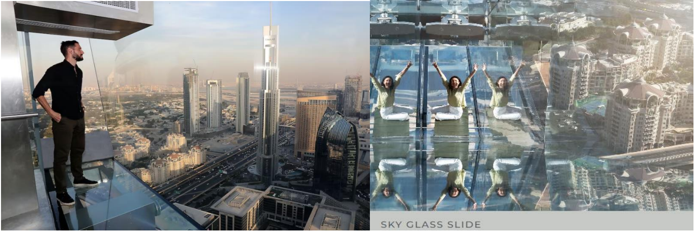
SKY GLASS SLIDE

22.30 น. ได้เวลาพอสมควรนำท่านเดินทางสู่ สนามบินดูไบ เพื่อเดินทางกลับสู่ กรุงเทพฯ → เห็นฟ้าสู่ ท่าอากาศยานสุวรรณภูมิ โดยสายการบิน EMIRATES เที่ยวบิน EK374 (บริการอาหารบนเครื่อง ใช้เวลาบิน 6.40 ชั่วโมง)