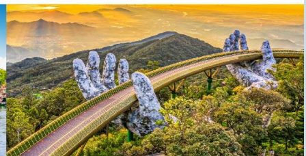
บานาฮิลล์

*กรณีห้องพัkbานาฮิลล์เต็ม ขอสงวนสิทธิ์ในการเปลี่ยนวันเข้าพัก และปรับเปลี่ยนโปรแกรมโดยคำนึงถึงผลประโยชน์ลูกค้าเป็นสำคัญ