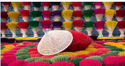
หมู่บ้านรูปหลากสี