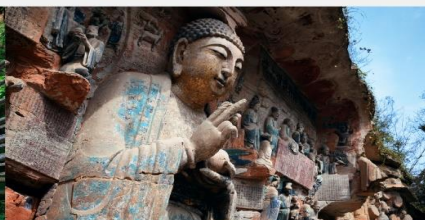
ผาหินแกะสลักต้าจู้ เขาเป่าตังซาน

*ทางบริษัทฯ ขอสงวนสิทธิ์ในการสลับโปรแกรมทัวร์ตามความเหมาะสมขึ้นอยู่กับสถานการณ์หน้างาน โดยคำนึงถึงผลประโยชน์ของลูกค้าเป็นสำคัญ