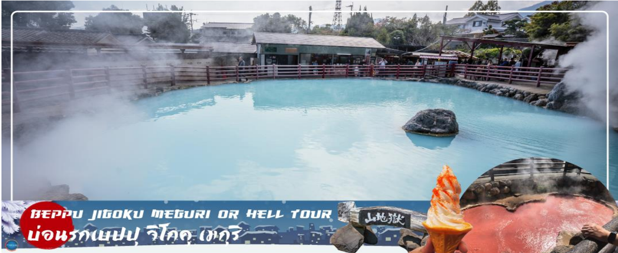
BEPPU JIGOKU MEGURI OR HELL TOUR บ่อนรกเบปปุ จิโกคุ เมกุริ

วันที่สาม เมืองเบปปุ – บ่อนรกเบปปุ จิโกคุ เมกุริ (เข้าชม 2 บ่อ) – เมืองยูฟูอิน – หมู่บ้านยูฟูอินฟลอรัล – ทะเลสาบคิริน – เมืองฟุกุโอกะ – วัดนันโซอิน – ดิวตี้ฟรี – กันดั้ม ปาร์ค ฟุกุโอกะ