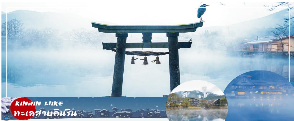
KIRIN LAKE ทะเลสาบคิริน

นำท่านสู่ บ่อนรกเบปปุ จิโกคุ เมกุริ (Beppu Jigoku Meguri Or Hell Tour) หรือบ่อน้ำพุร้อน ขุนมรกตทั้งแปด เป็นบ่อน้ำพุร้อนธรรมชาติที่เกิดขึ้น ภายหลังจากการระเบิดของภูเขาไฟ ประกอบไปด้วยแร่ธาตุที่เข้มข้น เช่น กำมะถัน แร่เหล็ก โซเดียม คาร์บอเนต เรเดียม เป็นต้น และร้อนเกินกว่าจะลงไปอาบได้ แล้วบ่อทั้ง 8 บ่อ ก็ตั้งชื่อให้น่ากลัวตามลักษณะภายนอกที่เห็น (ให้ท่านเข้าชม 2 บ่อ) นำท่านสู่ เมืองยูฟูอิน (Yufuin) เมืองเล็กๆ ในจังหวัดโออิตะ (Oita) ที่รู้จักกันดีในฐานะแหล่งออนเซ็นชื่อดัง และที่นี่ก็เต็มไปด้วยสถานที่ที่น่ารักๆ มีถนนที่เรียงรายไปด้วยคาเฟ่และร้านขายของเก๋ๆ ของกระจุกกระจิกมากมาย ระหว่างทางไม่ควรพลาดที่จะแวะ ยูฟูอินฟลอรัลวิลเลจ (Yufuin Floral Village) ฮิมปาร์คในบรรยากาศแห่งเทพนิยายที่ดูราวกับกำลังหลงเข้าไปในเหมือนจำลองหมู่บ้านสโตนโรโรป ร้านค้าทุกหลังเป็นสีเหลืองที่มีแต่ร้านที่มีสินค้าเป็นเอกลักษณ์ !!!ไฮไลท์ ประจำเมืองยูฟูอิน บ้านอิฐที่แสนคลาสสิกเรียงรายอยู่บนถนนสายเล็กๆ ประดับประดาไปด้วยดอกไม้บานาชนิด ภายในหมู่บ้านมีถนนช้อปปิ้ง มีร้านรวงต่างๆ ที่ตกแต่งได้อย่างน่ารัก ร้านไอศกรีม หรือ คาเฟ่ต่างๆ อย่าง Alice Tea คาเฟ่สุดชิคบรรยากาศเหมือนอยู่ในป่าและจับน้ำชากับ Mad Hatter หรือจะเป็นร้านขนม ที่มีเค้กวาดมาจาก Kiki's Delivery Service กลิ่นหอมของขนมปังอบอวล นากินสุดๆ นอกจากนี้ยังมี จุดพักผ่อนให้ผ่อนคลายเช่นเก้าอี้มากมาย เดินเลยจากถนนช้อปปิ้งไปท่านจะได้พบความงามของ ทะเลสาบคิริน (Kirin Lake) น้ำทะเลสาบใสเห็นตัวปลาแหวกว่ายในผืนน้ำ บางช่วงมีหมอกบางๆ ลง นับว่าคุ้มค่ากับการมาเห็นความงามนี้ด้วยตาตัวเองสักครั้งนึงอย่างแน่นอน อิสระให้ท่านเดินเล่นและถ่ายรูปตามอัธยาศัย