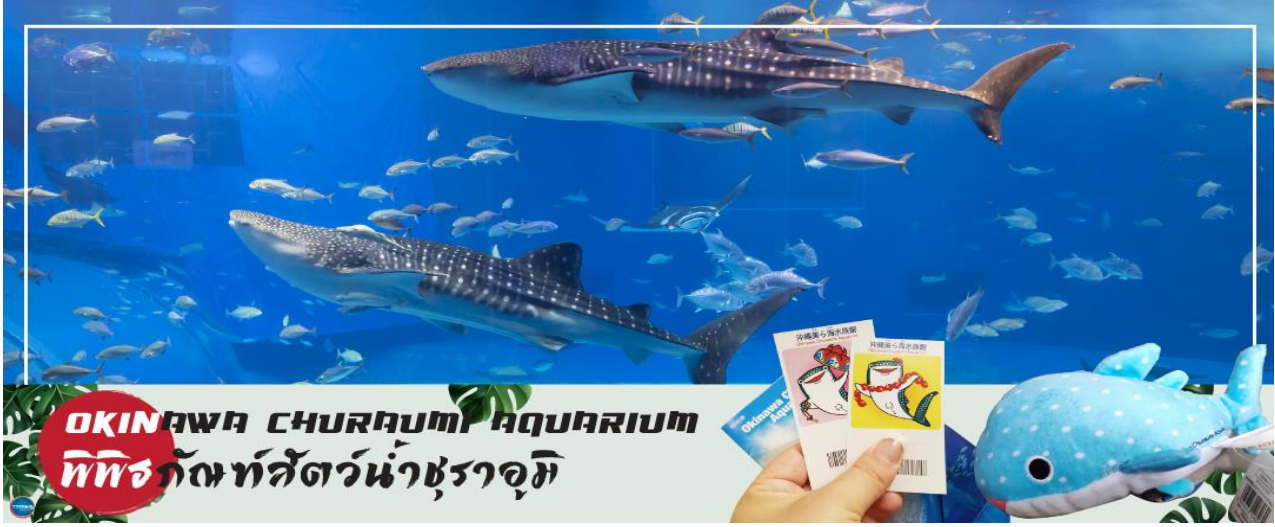
OKINAWA CHURAUMI AQUARIUM พิพิธภัณฑสัตว์น้ำชुरาอุมิ