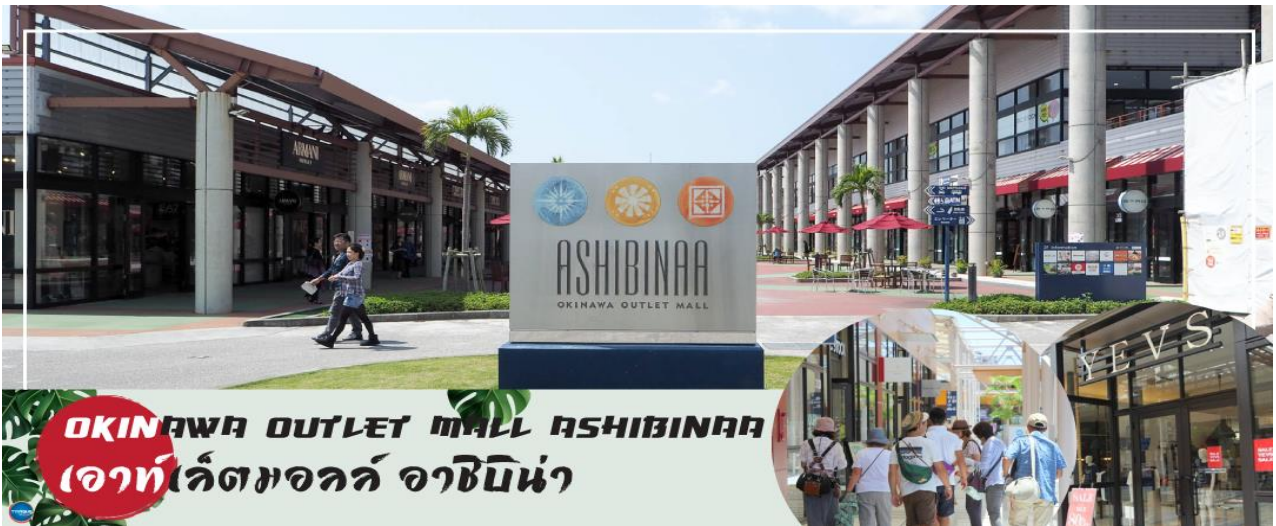
OKINAWA OUTLET MALL ASHIBINAA เอาท์เลตมอลล์ อาชิบิโน่า

จากนั้นนำท่านสู่ เอาท์เลตมอลล์ อาชิบิโน่า (Okinawa Outlet Mall Ashibinaa) (ใช้เวลาเดินทางประมาณ 30 นาที) เอาท์เลตแห่งแรกในโอกินาวะ รวบรวมร้านค้าชั้นนำกว่า 100 ร้าน ทั้ง เสื้อผ้าแฟชั่น สินค้าแบรนด์เนม นาฬิกา ข้าวของเครื่องใช้ ของเล่น ทุกร้านจัดเต็มทั้งสินค้านำเข้าและรุ่นใหม่ ลดราคากระหน่ำกว่า 30-80% ให้ได้เดินช้อปปิ้งตัดท้ายทริปกันอย่างจุใจ ภายใต้บรรยากาศสบายๆ สไตล์รีสอร์ทริมทะเล หากช้อปปิ้งเหนื่อยสามารถขึ้นไปทานอาหารที่ชั้น 2 มีอีกหลายร้านที่คอยให้บริการ