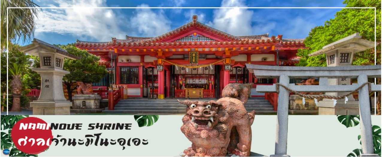
NAMINOUE SHRINE ศาลเจ้านะมิโนะอุเอะ