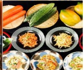
Hotel Art Stay Naha Kokusai-Dori