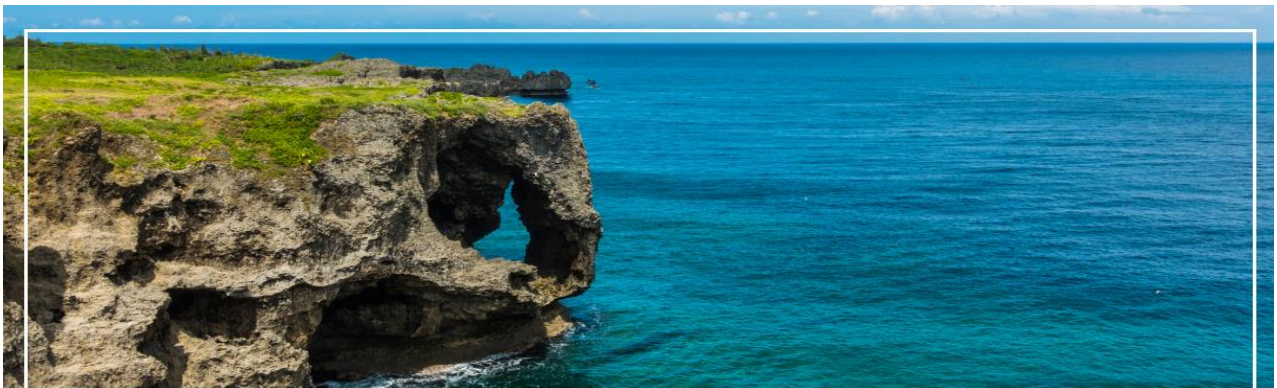
CAPE MANZAMO ฝามันซาโมะ

รับประทานอาหารเช้ากลางวัน ณ ภัตตาคาร (2)