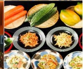
Hotel Art Stay Naha Kokusai-Dori