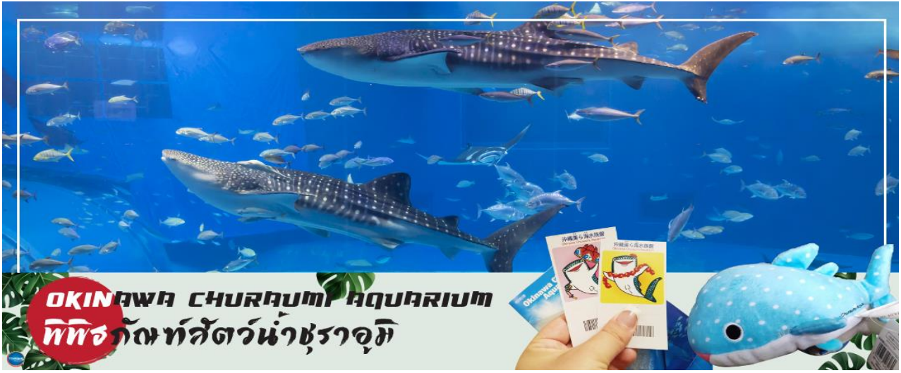
OKINAWA CHURAUMI AQUARIUM พิพิธภัณฑสัตว์น้ำชुरาอุมิ