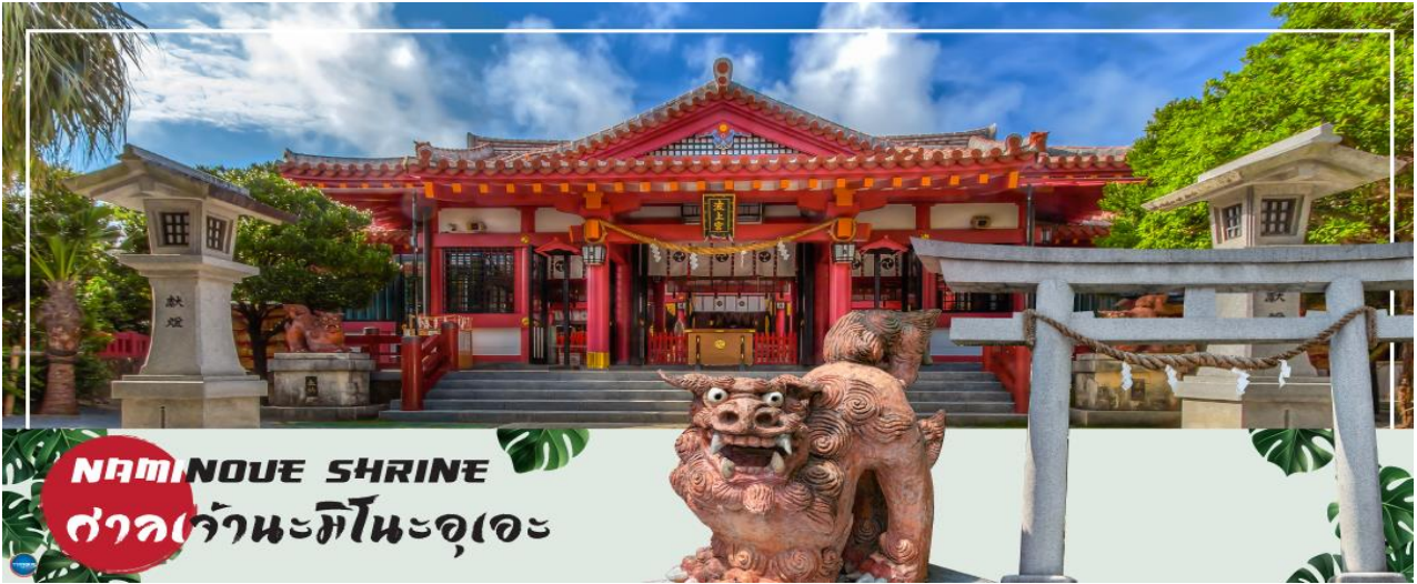
NAMINOUE SHRINE ศาลเจ้านะมิโนะอุเอะ

วันที่สี่ ศาลเจ้านามิโนะอุเอะ – อาชิบิโนะ เอาท์เล็ตมอลล์ – ท่าอากาศยานนาสะ โอกินาวา – ท่าอากาศยานดอนเมือง กรุงเทพฯ