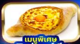
เมนูพิเศษ พิซซ่าจอร์เจีย Khachapuri

"นั่งรถ 4WD สู่ Gergeti Trinity Church โบสถ์เก่ากลางเทือกเขาคอเคซัส"