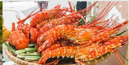
Nha Trang Night Market

*ทางบริษัทฯ ขอสงวนสิทธิ์ในการสลับโปรแกรมทัวร์ตามความเหมาะสมขึ้นอยู่กับสถานการณ์หน้างาน โดยคำนึงถึงผลประโยชน์ของลูกค้าเป็นสำคัญ