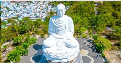
วัดลองเซิน