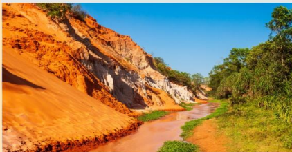
ลำธารนางฟ้า