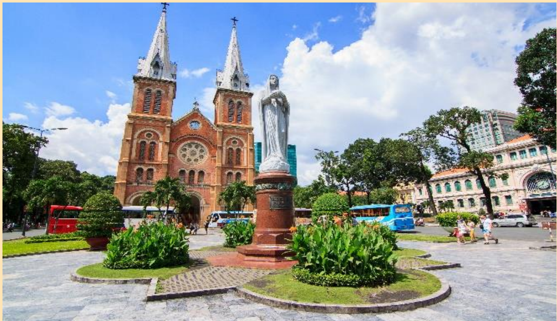
การผสมผสานอิทธิพลระหว่างยุโรป และเวียดนามอย่างลงตัวความสมบูรณ์ของโครงสร้างเป็น

จากนั้นนำท่านเดินทางสู่ กรุงโฮจิมินห์ (HO CHI MINH CITY) หรือชื่อเดิม “ไซ่ง่อน” เป็นเมืองใหญ่ที่สุดของประเทศเวียดนาม ตั้งอยู่บริเวณสามเหลี่ยมปากแม่น้ำโขง นครโฮจิมินห์เป็นศูนย์กลางทางเศรษฐกิจของเวียดนาม นำท่านถ่ายรูปด้านนอก โบสถ์นอร์ทเทรอดาม (Notre-Dame Cathedral) เป็นสถาปัตยกรรมอันงดงามที่มีความสำคัญทางประวัติศาสตร์และวัฒนธรรมวิหารแห่งนี้สร้างขึ้นในยุคอาณานิคมฝรั่งเศส และเป็นสัญลักษณ์ของมรดกอันมั่งคั่งและความศรัทธาอันยาวนานของชาวเมืองไซ่ง่อน วัสดุที่ใช้ก่อสร้างล้วนนำเข้ามาจากฝรั่งเศส เป็น