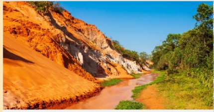
ลำธารนางฟ้า