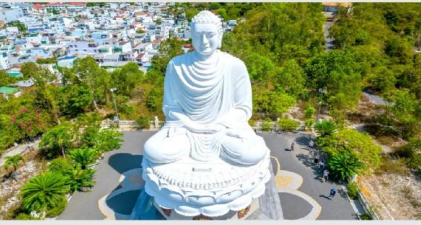
วัดลองเซิน