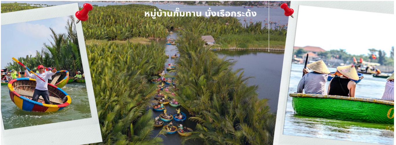
หมู่บ้านกิมถาน นั่งเรือกระดิง

จากนั้นนำท่านผ่านชม ภูเขาหินอ่อน Marble Mountains และนำท่านเข้าชม หมู่บ้านแกะสลักหินอ่อน ที่มีแหล่งวัดตูปหินอ่อนเนื้อดี และช่างแกะสลักฝีมือประณีต ส่งออกจำหน่าย ทั่วโลก จากนั้นนำท่านเดินทางสู่ หมู่บ้านกิมถาน สนุกสนานไปกับการเล่นกิจกรรม นั่งเรือกระดิง เป็นหมู่บ้านเล็กๆในเมืองฮอยอันตั้งอยู่ในสวนมะพร้าวริมแม่น้ำ ในอดีตช่วงสงครามที่นี่เป็นที่พักอาศัยของเหล่าทหาร อาชีพหลักของคนที่นี่คืออาชีพ