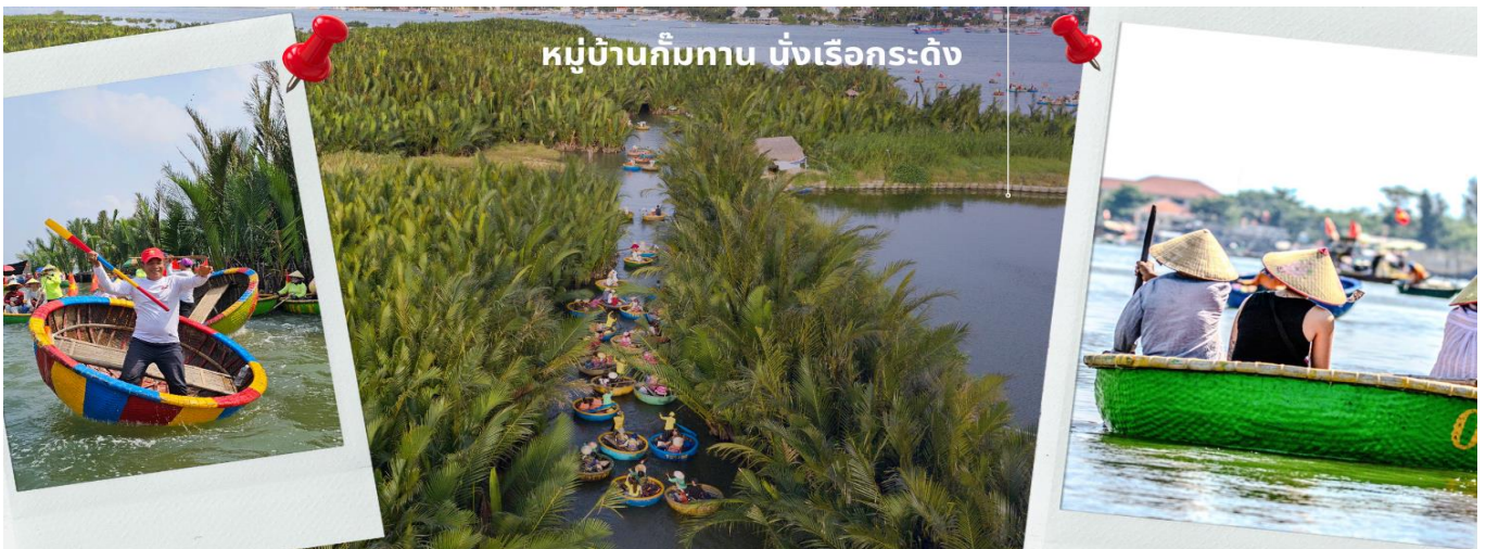
หมู่บ้านกิมทาน นั่งเรือกระดิง

จากนั้นนำท่านผ่านชม ภูเขาหินอ่อน Marble Mountains และนำท่านเข้าชม หมู่บ้านแกะสลักหินอ่อน ที่มีแหล่งวัดตูปหินอ่อนเนื้อดี และช่างแกะสลักฝีมือประณีต ส่งออกจำหน่าย ทั่วโลก จากนั้นนำท่านเดินทางสู่ หมู่บ้านกิมทาน สนุกสนานไปกับการเล่นกิจกรรม นั่งเรือกระดิง เป็นหมู่บ้านเล็กๆ ในเมืองฮอยอันตั้งอยู่ในสวนมะพร้าวริมแม่น้ำ ในอดีตช่วงสงครามที่นี่เป็นที่พักอาศัยของเหล่าทหาร อาชีพหลักของคนที่นี่คืออาชีพ