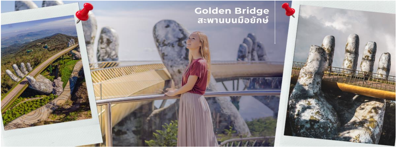
Golden Bridge สะพานบนมือยักษ์

REVISED CFDD4 ดานัง-ฮอยอัน-พักบานาฮิลล์ 3 วัน 2 คืน FD (NOV24-APR25)