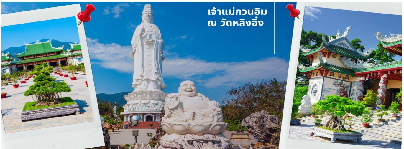
เจ้าแม่กวนอิม ณ วัดหลิงอิ่ง

นำท่านมัศจรรย์ใจ เจ้าแม่กวนอิม ณ วัดหลิงอิ่ง อยู่บนเกาะเซินตรา (Son Tra) ทางเหนือของเมืองดานัง เป็นวัดใหญ่ที่สุดของที่นี่ รูปปั้นปูนขาวของเจ้าแม่กวนอิมยืนหันหลังให้ภูเขา หันหน้าออกสู่ทะเลเพื่อเป็นการปกป้องคุ้มครองชาวประมงที่ออกไปหาปลา เสียงระฆังวัดที่ตีประสานกับเสียงคลื่นนั้นช่วยให้ชาวเรือรู้สึกสงบ