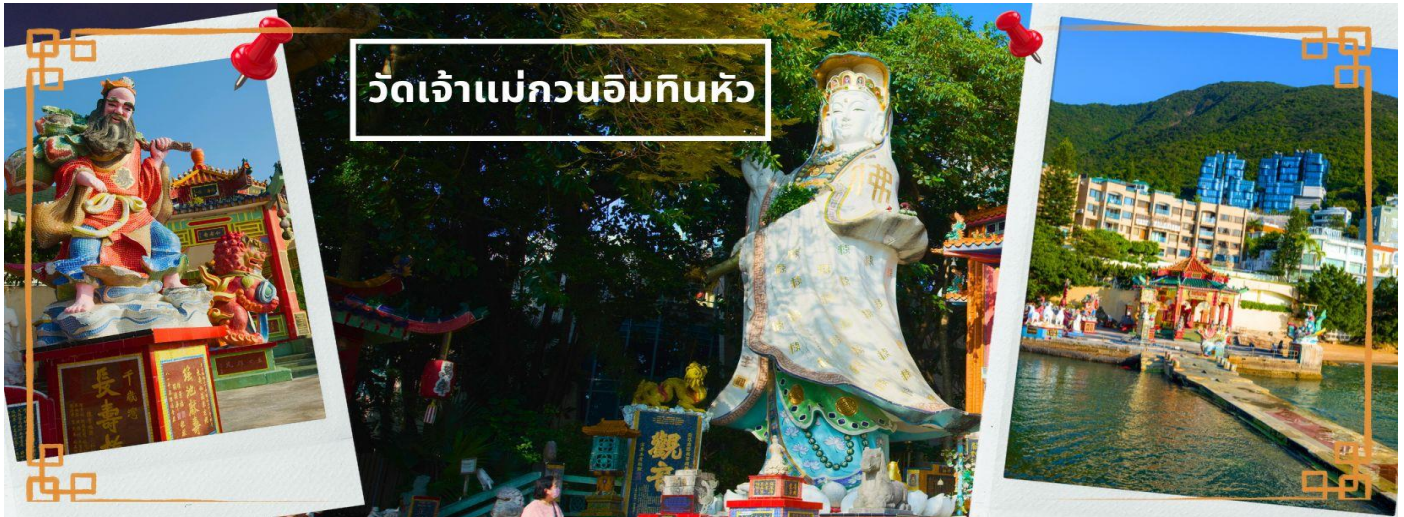
วัดเจ้าแม่กวนอิมทินหัว

จากนั้นนำท่านเดินทางสู่ วัดเจ้าแม่กวนอิมทินหัว อ่าวรีพัลส์เบย์ (TIN HAU TEMPLE REPULSE BAY) ตั้งอยู่ริมทะเล เป็นสถานที่ท่องเที่ยวสำคัญ สร้างขึ้นในปี ค.ศ. 1993 วัดแห่งนี้ถูกสร้างขึ้นเพื่อคุ้มครองชาวประมงในการออกเรือไปหาปลา ซึ่งเป็นหนึ่งในวัดที่เก่าแก่ที่สุดของฮ่องกง บริเวณวัดจะมี เจ้าแม่กวนอิมองค์ใหญ่ ปางประทานพรตั้งอยู่ เป็นเทพที่ชาวฮ่องกงและคนจีนให้ความเคารพนับถือมากที่สุด สามารถขอพรได้ทุกอย่าง วัดนี้เป็นที่นิยมมีนักท่องเที่ยวเดินทางมาขอพรกันมากมาย เพราะเชื่อในความศักดิ์สิทธิ์ และยังมี เจ้าแม่ทับทิม หรือ เทพธิดาแห่งท้องทะเลองค์ใหญ่ ซึ่งคนฮ่องกง คนมาเก๊า และคนจีน ที่อยู่ริมทะเล ชาวประมง นักเดินเรือหรือผู้ที่เดินทางทางเรือเป็นประจำ จะนับถือเจ้าแม่ทับทิมเป็นอย่างมาก มีความเชื่อว่าเจ้าแม่ทับทิมจะปกป้องเราจากภัยอันตรายระหว่างการเดินทาง ภายในวัดยังมีเทพเจ้าและพระพุทธรูปต่างๆ ประดิษฐานไว้มากมายตามความเชื่อถือศรัทธา เช่น เทพเจ้าไฉ่ซิงเอี้ย ไหว้ขอโชคลาภความมั่งคั่ง ความร่ำรวย, พระสังกัจจายน์โพธิสัตว์ เทพประทานบุตร-ธิดา ไหว้อธิษฐานขอลูก, สะพานต่ออายุ (สะพานอายุยืน) สะพานสีแดงตั้งอยู่บนริมหาด สีแดงสด ชาวจีนเชื่อกันว่าหากเดินข้ามสะพานนี้ เราจะมีอายุยืนขึ้นอีก 3 วัน (3 วัน บนสวรรค์ = 3 ปี บนโลกมนุษย์) นั่นหมายความว่า ถ้าเราเดินข้ามสะพานนี้แล้ว จะมีอายุยืนยาวขึ้นอีก 3 ปี บนโลกมนุษย์, เทพเจ้าแห่งความรัก ไหว้ขอเนื้อคู่, ศาลา 8 เหลี่ยม เชื่อกันว่าเป็นจุดที่มีฮวงจุ้ยดีที่สุด ภายในศาลาแปดเหลี่ยม จุดกึ่งกลางของพื้นจะมีรูปแปดเหลี่ยม ให้เราไปยืนขอพรจากตำแหน่งนี้เพื่อขอพรหลังจากสวรรค์ และอีกมากมาย