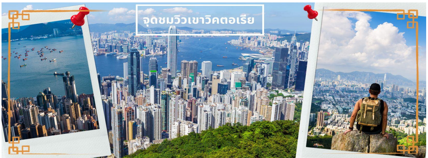
จุดชมวิวกาวิกตอเรีย

จากนั้นเดินทางสู่เกาะฮ่องกง นำท่านขึ้นสู่ จุดชมวิวกาวิกตอเรีย โดยรถโค้ช ตีมต่ากับบรรยากาศของฮ่องกงแบบพาโนรามา 360 องศา เป็นจุดชมวิวมุมสูงของฮ่องกง ให้ท่านถ่ายรูปตามอัธยาศัย ตื่นตาตื่นใจกับ