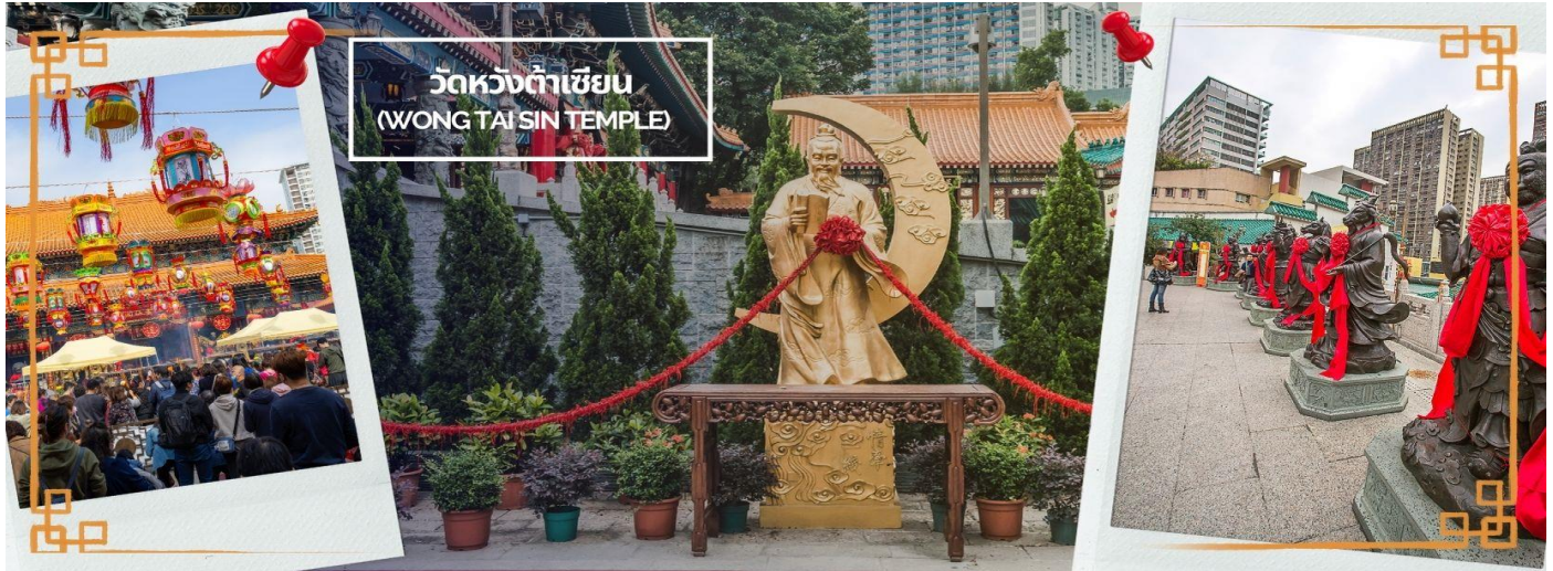
วัดหวังต้าเซียน (WONG TAI SIN TEMPLE)

ภายใต้แสงจันทร์ เป็นเทพเจ้าผู้เป็นอมตะที่อาศัยอยู่บนดวงจันทร์ และลงมาโลกมนุษย์เพื่อผูกด้วยดวงชะตา ระหว่างคู่รักซึ่งเมื่อคู่กันแล้วก็จะไม่แคล้วคลาดกัน