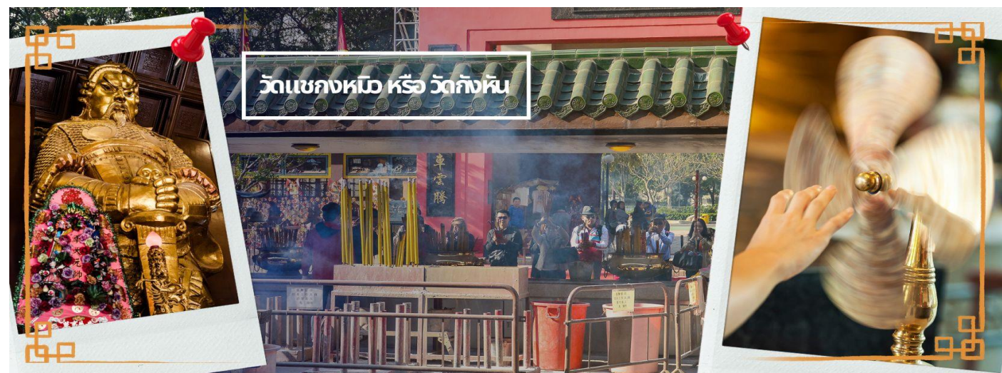
วัดแชกงหมิว หรือ วัดกั๊กหัน

จากนั้นนำท่านเดินทางไป วัดแชกงหมิว หรือ วัดกั๊กหัน (CHE KUNG TEMPLE) วัดแชกงสร้างขึ้นเพื่อเป็นอนุสรณ์เพื่อรำลึกถึงตำนานแห่งนักรบราชวงศ์ซ่ง มีนามว่า “แช กง” แม่ทัพปราบศึก ผู้คนทั่วทุกดินแดนต่างยำเกรงในกำลังพลอันกล้าหาญแข็งแกร่งของแม่ทัพแชกง เป็นวัดเก่าแก่ที่มีความศักดิ์สิทธิ์มาก มีอายุกว่า 300 ปี ตั้งอยู่ในเขต SHATIN มีประวัติเล่าต่อกันมาว่า ขณะที่แม่ทัพปราบศึก อยู่นั้น ทุกแคว้นเขตแดนแผ่นดินใหญ่ต่างก็ยำเกรงต่อกำลังพลที่กล้าหาญในกองทัพของท่าน ยามที่ออกรบเพื่อต้านข้าศึกศัตรูทุกทิศทาง ทุก ๆ ครั้งท่านใช้สัญลักษณ์รูปกั๊กหัน 4 ใบพัดติดไว้ด้านหลังรถศึกนำ ขบวนในกองทัพ เหล่าทหารกล้ามีความเชื่อว่าเมื่อพกพาสัญลักษณ์รูปกั๊กหันนี้ไป ณ ที่ใด ๆ กั๊กหันนี้จะช่วยเสริมสิริมงคล นำพาแต่ความโชคดี มีอำนาจเข้มแข็ง เสริมกำลังใจให้แก่กองทัพของท่าน ชื่อเสียงในการนำทัพสู้ศึกของท่านจึงเป็นตำนานมาจนทุกวันนี้ ปัจจุบันวัดแชกงจึงเป็นสถานที่สักการะเคารพ ขอพร ท่านแชกง โดยมีสัญลักษณ์เป็นกั๊กหันนำโชคนั่นเอง 🌀 การหมุนกั๊กหันนำโชคที่ตั้งอยู่ในวัด เพื่อจะได้หมุนเวียนชีวิตของเราและครอบครัวให้มีความเจริญก้าวหน้าด้านหน้าที่การงาน โชคลาภ ยศศักดิ์ และถ้าหากคนที่ดวงไม่ดีมีเคราะห์ร้ายก็ถือว่าเป็นการช่วยหมุนปัดเป่าเอาสิ่งร้ายและไม่ดีออกไปให้