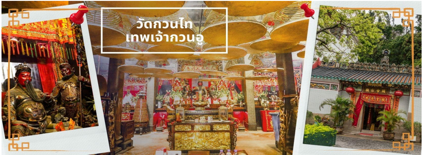
วัดกวนไท เทพเจ้ากวนอู

จากนั้นนำท่านเดินทางสู่ วัดกวนไท เป็นสถานศักดิ์สิทธิ์อันเลื่องชื่อ ถือว่าเป็นวัดแห่งเดียวในเขตเกาลูน ที่สร้างขึ้นเพื่อบูชา เทพเจ้ากวนอู ซึ่งท่านเป็นเทพเจ้าแห่งความซื่อสัตย์ เปี่ยมไปด้วยคุณธรรม โดยศาลเจ้าพ่อกวนอูแห่งนี้ ผู้ที่มาไหว้สักการะจะนิยมขอพรเรื่องธุรกิจและบิรวาร เนื่องจากว่าเจ้าพ่อกวนอู เป็นเทพเจ้าที่รักษาคำพูดด้วยชีวิต รักคุณธรรม ซื่อสัตย์ ช่วยปกป้องสิ่งเลวร้าย อันตรายต่าง ๆ และช่วยเสริมอำนาจบารมีในการปกครอง ท่านมีจิตใจมั่นคงตั้งขุนเขา มีสติปัญญาเป็นเลิศ และไม่ประมาท ท่านจึงเป็นสัญลักษณ์แห่งความเข้มแข็งโดดเด่น ไม่ครั้นคร้ามต่อศัตรู ฉะนั้นการมาบูชาขอพรท่าน จะช่วยเสริมดวงไม่ให้เพลี่ยงพล้ำแก่ศัตรู ทำให้มีมิตรที่ซื่อสัตย์ และคุ้มครองบิรวารให้ก้าวหน้าและอยู่เย็นเป็นสุข ซึ่งผู้ประกอบการอาชีพ ตำรวจ ทหาร และ นักการเมือง จึงมักจะนิยมบูชาเทพเจ้ากวนอู เป็นพิเศษ