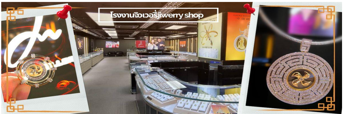
โรงงานจิวเวลรี่jewelry shop

วันตรุษจีน ซึ่งพิธีนี้ใน 1 ปี มีเพียงครั้งเดียวเท่านั้นจากนั้น จากนั้นนำท่านชม โรงงานจิวเวลรี่ ซึ่งเป็นโรงงานที่มีชื่อเสียงที่สุดของฮ่องกงในเรื่องการออกแบบเครื่องประดับ อาทิเช่น จี้ และแหวนกำหั้น ที่สวยงามโดดเด่นไม่เหมือนใคร ซึ่งถือกำเนิดขึ้นที่นี่และมีชื่อเสียงที่สุดใช้เป็นเครื่องประดับติดตัว และเสริมดวงชะตา สินค้าทุกชิ้นมีเอกสารรับประกันคุณภาพเปลี่ยน ซ่อม ใต้ตลอดอายุการใช้งาน หากเกิดการชำรุดจากสินค้าไม่ใช่อุบัติเหตุ และนำท่านเลือกซื้อ เครื่องประดับที่ ร้านหยก ซึ่งคนจีนนั้นถือว่าหยกเป็นหิน ที่เป็นตัวแทนของความสวยงามและความบริสุทธิ์ มีความเชื่อว่าหยกมงคล ถ้าพกติดตัวไว้จะอายุยืนและสุขภาพดี