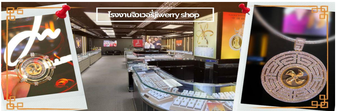
โรงงานจิวเวลรี่jewerry shop

วันตรุษจีน ซึ่งพิธีนี้ใน 1 ปี มีเพียงครั้งเดียวเท่านั้นจากนั้น จากนั้นนำท่านชม โรงงานจิวเวลรี่ ซึ่งเป็นโรงงานที่มีชื่อเสียงที่สุดของฮ่องกงในเรื่องการออกแบบเครื่องประดับ อาทิเช่น จี้ และแหวนกำหั้น ที่สวยงามโดดเด่นไม่เหมือนใคร ซึ่งถือกำเนิดขึ้นที่นี่และมีชื่อเสียงที่สุดใช้เป็นเครื่องประดับติดตัว และเสริมดวงชะตา สินค้าทุกชิ้นมีเอกสารรับประกันคุณภาพเปลี่ยน ซ่อม ได้ตลอดอายุการใช้งาน หากเกิดการชำรุดจากสินค้าไม่ใช่อุบัติเหตุ และนำท่านเลือกซื้อ เครื่องประดับที่ ร้านหยก ซึ่งคนจีนนั้นถือว่าหยกเป็นหิน ที่เป็นตัวแทนของความสวยงามและความบริสุทธิ์ มีความเชื่อว่าหยกมงคล ถ้าพกติดตัวไว้จะอายุยืนและสุขภาพดี