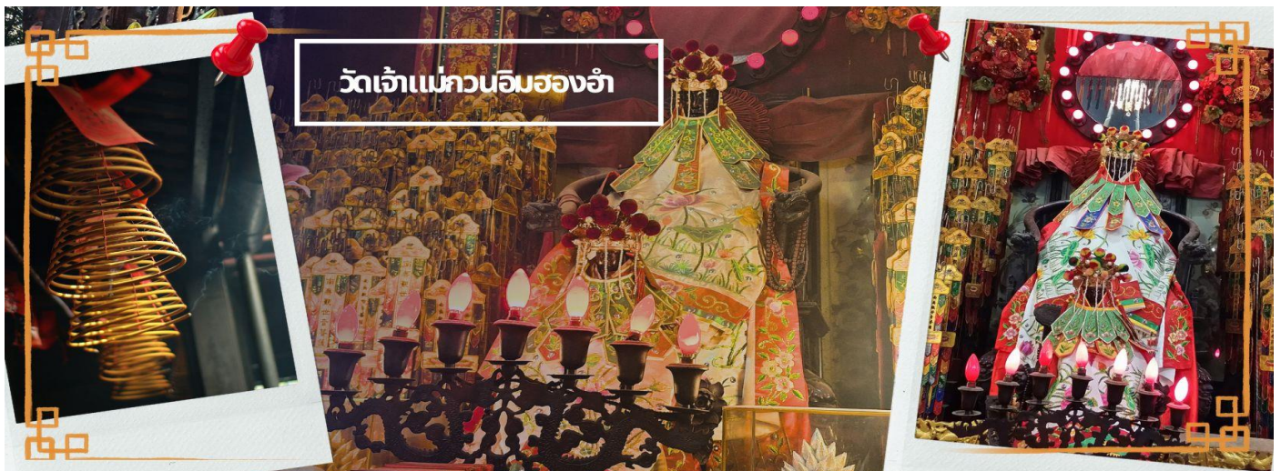
วัดเจ้าแม่กวนอิมฮองฮ่า

จากนั้นนำทุกท่านเดินทางสู่ วัดเจ้าแม่กวนอิมฮองฮ่า (HUNG HOM KWUN YUM TEMPLE) เป็นหนึ่งในวัดที่ชาวฮ่องกงนั้นเลื่อมใสกันมาก ด้วยความที่เจ้าแม่กวนอิมนั้นเป็นเทพเจ้าแห่งความเมตตา ฉะนั้นเมื่อใครมีทุกข์ร้อนอะไรก็มักจะมาราบไหว้ขอพรให้เจ้าแม่ช่วยเหลือ วัดนี้ถูกสร้างขึ้นในปี ค.ศ. 1873 ในช่วงสงครามโลกครั้งที่ 2 มีการปล่อยระเบิดลงบริเวณวัดฮ่องฮ่าหลายต่อหลายครั้ง ทำให้มีผู้บาดเจ็บและล้มตายมากมาย แต่ชาวบ้านที่หนีเข้าไปหลบภัยในวัดนี้ก็กลับปลอดภัยและตัววัดก็ไม่ได้รับความเสียหายจากเหตุการณ์ทั้งระเบิดอย่างน่าอัศจรรย์ และวันสำคัญอีกวันหนึ่งที่คนหลังไหลมาไหว้ขอพรอย่างไม่ขาดสาย และรอคอยเป็นประจำทุกปี ก็คือ "วันเปิดทรัพย์" หรือ วันยืมเงินเทพเจ้า เป็นวันที่จะมาขอพรและยืมเงินเจ้าแม่กวนอิม ซึ่งตรงกับวันที่ 26 นับจาก