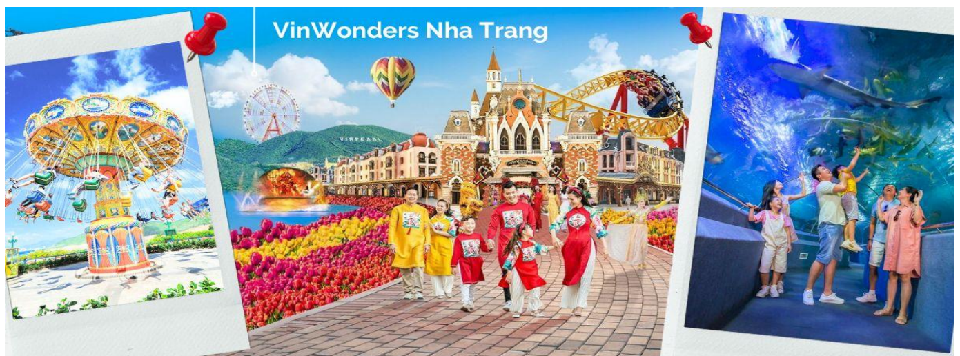
VinWonders Nha Trang

นำคณะขึ้นกระเช้าข้ามทะเล เพื่อข้ามไปยังเกาะ Hon Tre เที่ยวสวนสนุกวินวันเดอร์ (VinWonders Nha Trang) หรือ วินเพิร์ลแลนด์ ญาจาง (Vinpearl Land Nha Trang) ซึ่งเป็นสวนสนุกขนาดใหญ่ที่ตั้งอยู่บนเกาะ อีกฝั่งของเมืองญาจางใหญ่ถึงการจนเราสามารถมองเห็นได้จากฝั่งชายหาดเมืองญาจาง นับเป็นสวนสนุกที่มีชื่อเสียงจากทั้งชาวเวียดนาม และชาวต่างชาติ และเป็นอีก 1 กิจกรรมที่ไม่ควรพลาด เพื่อคุณมาเยือนเมืองญาจาง โดยแบ่งพื้นที่ออกเป็น 6 โซนหลัก 1.Fairy Land 2.Adventure Land 3.King Garden 4.World Garden 5.Sea World 6.Tropical Paradise (ค่าทัวร์รวมค่าบัตรและเครื่องเล่นเรียบร้อยแล้ว)