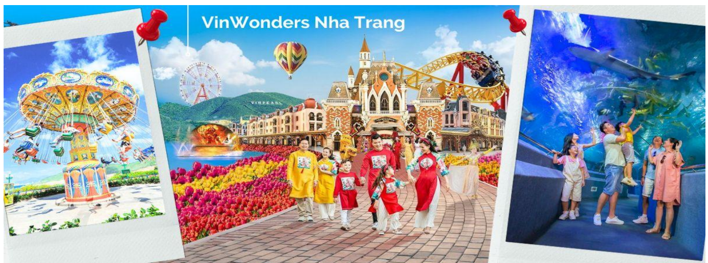
VinWonders Nha Trang

นำคณะขึ้นกระเช้าข้ามทะเล เพื่อข้ามไปยังเกาะ Hon Tre เที่ยวสวนสนุกวินวันเดอร์ (VinWonders Nha Trang) หรือ วินเพิร์ลแลนด์ ญาจาง (Vinpearl Land Nha Trang) ซึ่งเป็นสวนสนุกขนาดใหญ่ที่ตั้งอยู่บนเกาะ อีกฝั่งของเมืองญาจางใหญ่ถึงการจนเราสามารถมองเห็นได้จากฝั่งชายหาดเมืองญาจาง นับเป็นสวนสนุกที่มีชื่อเสียงจากทั้งชาวเวียดนาม และชาวต่างชาติ และเป็นอีก 1 กิจกรรมที่ไม่ควรพลาด เพื่อคุณมาเยือนเมืองญาจาง โดยแบ่งพื้นที่ออกเป็น 6 โซนหลัก 1.Fairy Land 2.Adventure Land 3.King Garden 4.World Garden 5.Sea World 6.Tropical Paradise (ค่าทัวร์รวมค่าบัตรและเครื่องเล่นเรียบร้อยแล้ว)