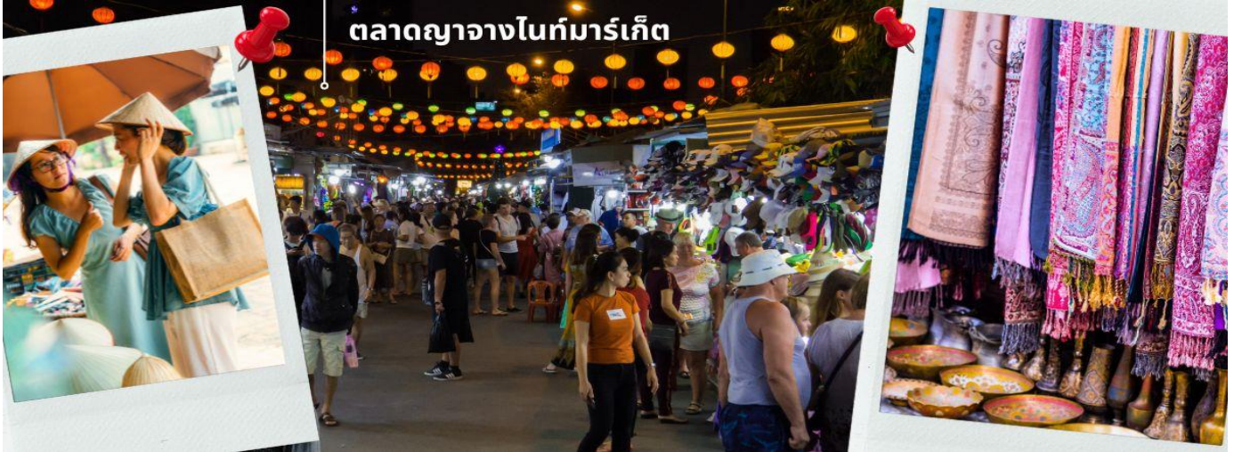
ตลาดญาจางไนท์มาร์เก็ต

ชื่อของฝากของที่ระลึก จนกลายเป็นแหล่งรวมนักท่องเที่ยว และวัยรุ่นในเมืองญาจาง ออกมาเดินเที่ยว และเลือกซื้อสินค้า กันอย่างคึกคัก