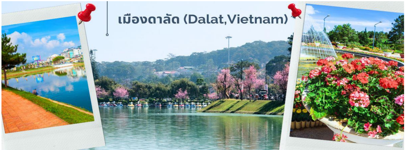
เมืองดาลัด (Dalat, Vietnam)

จากนั้นออกเดินทาง มุ่งหน้าสู่เมืองดาลัด โดยใช้เวลาเดินทางประมาณ 3.30 ชั่วโมง (ระหว่างเส้นทางมีจุดแวะพักรถและจำหน่ายสินค้า) ดาลัดเป็นเมืองหลวงของจังหวัดเลิมด่ง และเป็นเมืองที่ใหญ่ที่สุดในภูมิภาคที่สูงตอนกลางของประเทศเวียดนาม มีความสูงจากระดับน้ำทะเลประมาณ 1,500 เมตร (4,900 ฟุต) มีอากาศเย็น โดยมีอุณหภูมิเฉลี่ย 18 ถึง 25 องศาเซลเซียส อุณหภูมิสูงสุดที่เคยเกิดขึ้นในดาลัด คือ 27 องศาเซลเซียส และต่ำสุดคือ 6.5 องศาเซลเซียส เป็นหนึ่งในเมืองท่องเที่ยวยอดนิยมในเวียดนาม