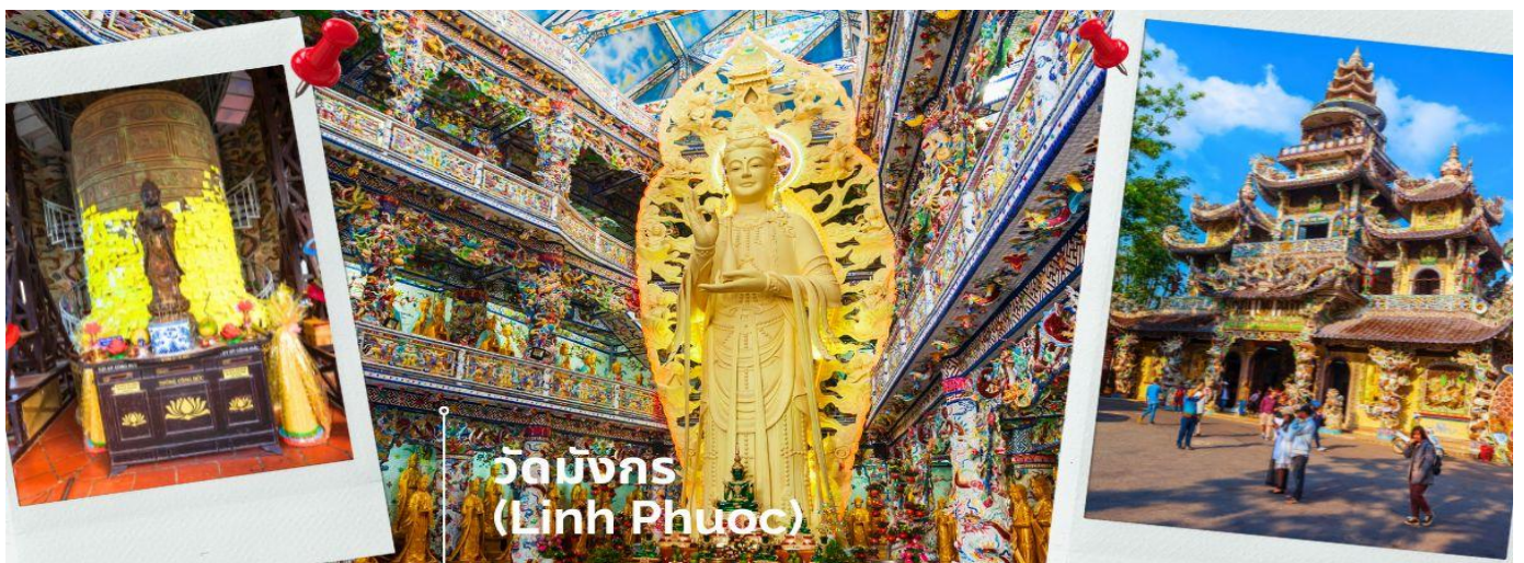
วัดมังกร (Linh Phuoc)

เมื่อเดินทางถึงเมืองดาลัด นำท่านขอพร วัดมังกร (Linh Phuoc) เป็นอีกหนึ่งวัดที่เหล่าพุทธศาสนิกชนที่มีโอกาสเดินทางไปท่องเที่ยวที่ประเทศเวียดนามควรจะต้องแวะไปเพื่อสักการะ สิ่งศักดิ์สิทธิ์ของที่นี่ ที่บอกได้เลยว่าเป็นอีกหนึ่งวัดในประเทศเวียดนามที่มีความสวยงามอย่างมากที่สำคัญตัวอาคารของวัดทำจากเศษกระเบื้องเซรามิก และมีมังกรที่ทำขึ้นจากขวดเบียร์ จำนวน 12,000 ขวด บริเวณใกล้ๆยังสามารถชื่นชมทะเลสาบเล็กๆ และสวนดอกไม้ที่มีความสวยงามทำให้รู้สึกถึงความสงบร่มเย็นในการอยู่ในบริเวณแห่งนี้ นอกจากนี้แล้วพื้นที่บริเวณวัดยังมีเจ้าแม่กวนอิมสีทององค์ใหญ่ที่ทำจากดอกไม้กระดาษ ที่มีความสวยงามให้เหล่าบรรดาผู้ศรัทธาได้ไปสักการะ