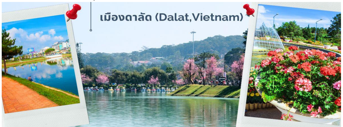
เมืองดาลัด (Dalat, Vietnam)

จากนั้นออกเดินทาง มุ่งหน้าสู่เมืองดาลัด โดยใช้เวลาเดินทางประมาณ 3.30 ชั่วโมง (ระหว่างเส้นทางมีจุดแวะพักรถและจำหน่ายสินค้า) ดาลัดเป็นเมืองหลวงของจังหวัดเลิมด่ง และเป็นเมืองที่ใหญ่ที่สุดในภูมิภาคที่สูงตอนกลางของประเทศเวียดนาม มีความสูงจากระดับน้ำทะเลประมาณ 1,500 เมตร (4,900 ฟุต) มีอากาศเย็น โดยมีอุณหภูมิเฉลี่ย 18 ถึง 25 องศาเซลเซียส อุณหภูมิสูงสุดที่เคยเกิดขึ้นในดาลัด คือ 27 องศาเซลเซียส และต่ำสุดคือ 6.5 องศาเซลเซียส เป็นหนึ่งในเมืองท่องเที่ยวยอดนิยมในเวียดนาม