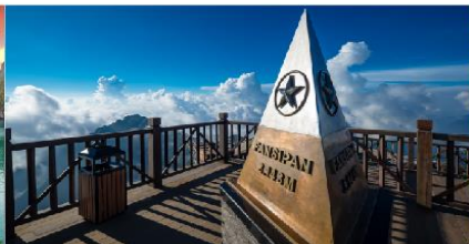
ยอดเขาฟานซิปิน