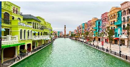
เมก้าแกรนด์เวิลด์ฮานอย

*ทางบริษัทฯ ขอสงวนสิทธิ์ในการสลับโปรแกรมทัวร์ตามความเหมาะสมขึ้นอยู่กับสถานการณ์หน้างาน โดยคำนึงถึงผลประโยชน์ของลูกค้าเป็นสำคัญ