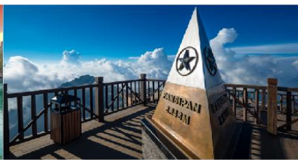
ยอดเขาฟานซิปิน