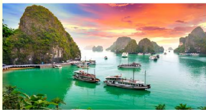
ล่องเรือชมอ่าวฮาลอง