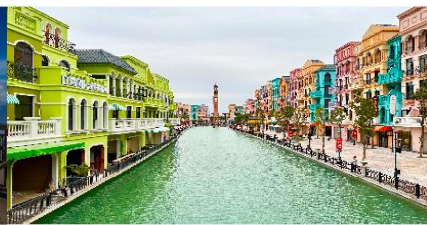
เมก้าแกรนด์เวิลด์ฮานอย

*ทางบริษัทฯ ขอสงวนสิทธิ์ในการสลับโปรแกรมทัวร์ตามความเหมาะสมขึ้นอยู่กับสถานการณ์หน้างาน โดยคำนึงถึงผลประโยชน์ของลูกค้าเป็นสำคัญ