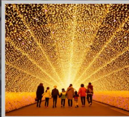
“NABANA NO SATO”