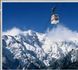
“SHIN HOTAKA ROPEWAY”