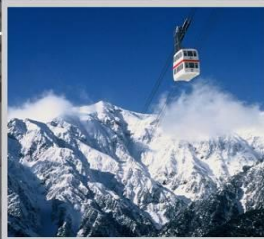
“SHIN HOTAKA ROPEWAY”