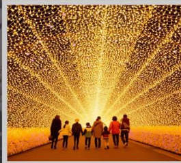
“NABANA NO SATO”