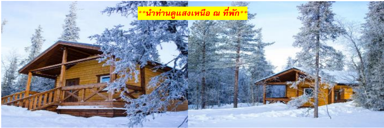
**นำท่านดูแสงเหนือ ณ ที่พัก**

*** การพบเห็นปรากฏการณ์แสงเหนือ เป็นปรากฏการณ์ทางธรรมชาติ ไม่สามารถกำหนดหรือทราบล่วงหน้าได้ โอกาสที่จะได้เห็นขึ้นอยู่กับสภาพอากาศเป็นสำคัญ โดยช่วงปลายฤดูใบไม้ร่วงจนถึงต้นฤดูใบไม้ผลิ ในเดือนตุลาคม กุมภาพันธ์ และ มีนาคม เป็นเดือนที่เหมาะสมสำหรับการชมออโรราทางซีกโลกเหนือ มักจะเกิดในช่วงเวลาสี่ทุ่มจนถึงเที่ยงคืน และโปรแกรมอาจมีการปรับเปลี่ยนได้ตามความเหมาะสม***