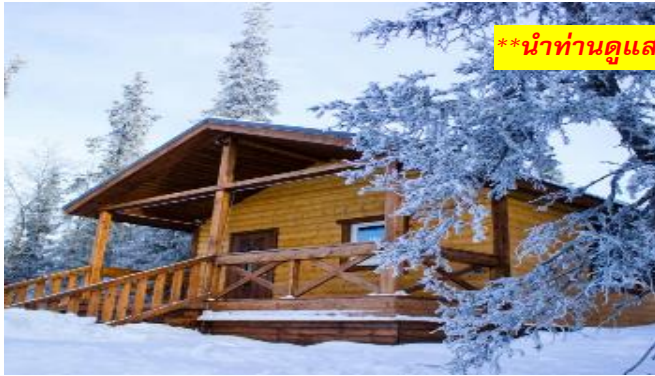
**นำท่านดูแสงเหนือ ณ ที่พัก**

คำ รับประทานอาหารพื้นเมือง ณ ที่พัก พิเศษ...ให้ทุกท่านได้ชิมเนื้อกวางเรนเดียร์