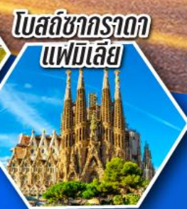
โบสถ์ซากราดา แฟมิลีย